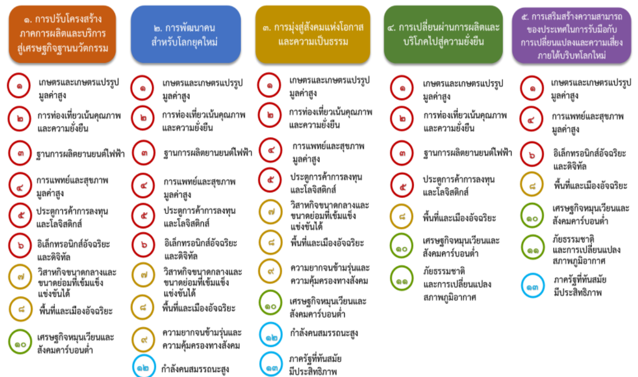
แผนภาพที่ ๓.๑ ความเชื่อมโยงระหว่างหมวดหมู่การพัฒนา กับเป้าหมายหลัก

ความเชื่อมโยงระหว่างหมวดหมู่การพัฒนา กับเป้าหมายหลักแสดงไว้ในแผนภาพที่ ๓.๑ โดยหมวดหมู่การพัฒนาที่กำหนดขึ้นเป็นประเด็นที่มีลักษณะเชิงบูรณาการที่ครอบคลุมการพัฒนาตั้งแต่ในระดับต้นน้ำจนถึงปลายน้ำ และสามารถนำไปสู่ผลพัฒนาทั้งในมิติเศรษฐกิจ สังคม ทรัพยากรธรรมชาติและสิ่งแวดล้อมไปพร้อมๆ กัน ทำให้หมวดหมู่แต่ละประการสามารถสนับสนุนเป้าหมายหลักได้มากกว่าหนึ่งข้อ นอกจากนี้การพัฒนาภายใต้แต่ละหมวดหมู่ไม่ได้แยกขาดจากกัน แต่มีการสนับสนุนหรือเอื้อประโยชน์ซึ่งกันและกัน